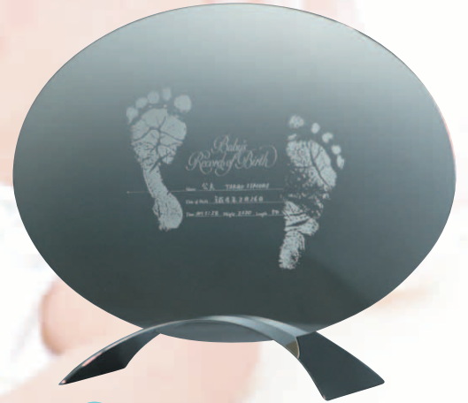
C 天使のたまご (卓上 + 一輪挿し) 壁掛としても使えます。 no: N-A-ET size: W250×D80×H200mm ¥27,000(税別・送料別)