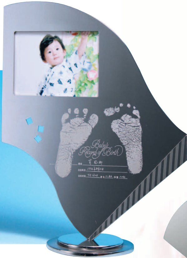
A 天使の翼 (フォトフレーム + 卓上) no: N-A-W ●意匠登録 1358057号 size: W225×D100×H280mm ¥55,000(税別・送料別)