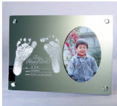
E 天使の希望 (フォトフレーム + 卓上) ● no: N-A-HO ● no: N-A-HS ●意匠登録 1368080号 ●意匠登録 1368081号 size: W220×D32×H160mm ¥24,000(税別・送料別)