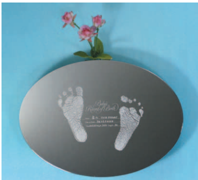
D 天使のたまご (壁掛 + 一輪挿し) no: N-A-EH size: W250×D32×H175mm ¥23,000(税別・送料別)

既製のデザインに思い出の絵柄をエッチングします。 ステンレスの鏡面効果でどんな空間にも合い、 サビや割れもありません。いつまでも美しく飾れます。