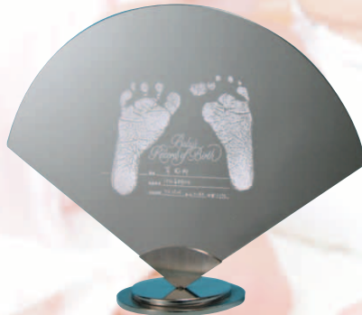
B 天使の未来 (卓上) no: N-A-F ●意匠登録 第1358058号 size: W265×D90×H215mm ¥36,000(税別・送料別)