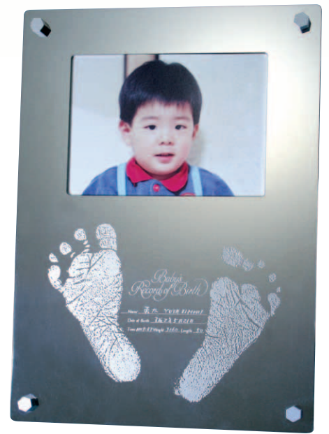
F 天使の夢 (フォトフレーム + 卓上) ● no: N-A-DO ● no: N-A-DS ●意匠登録 1367702号 ●意匠登録 1368079号 size: W160×D32×H220mm ¥24,000(税別・送料別)